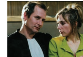
« Les enfants d'abord » d'Aline Issermann