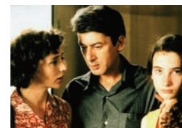
« L'ombre du doute » d'Aline Issermann